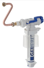
Figura di esempio